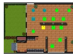
Plan de salle