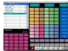
Ecran de vente